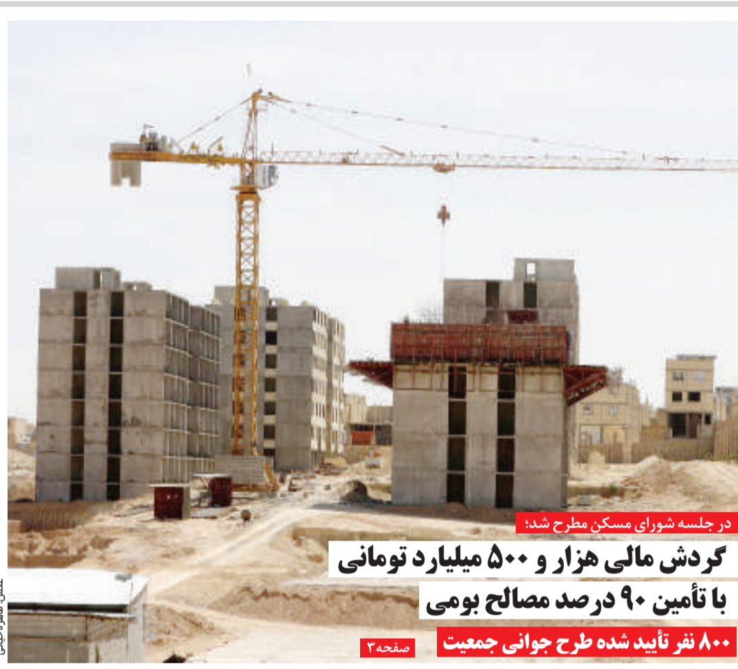
در جلسه شورای مسکن مطرح شد:

به همر ترتیب اعلام آمار اشتغال در استان چند روزیست مورد بحث است و دائماً از سوی مدیران مختلف تکذیب و در حاشیه جلسات به آن اشاره می‌شود و مدعی هستند آمار از مرکز تأیید شده تهیه نشده است آمار باید از منابع رسمی پیگیری شود در حالی که رجوع به منابع رسمی نیز گویای واقعیت‌هایی است که اتفاقاً به‌راحتی پذیرفته نمی‌شود و همچنان موضوع کمیت و کیفیت همیشه مورد بحث بوده و خواهد بود. شاید بهتر باشد برخی مدیران به جای گلایه و ناراحت شدن نسبت به آمار ارائه شده و نادیده گرفتن خدمات‌شان، در کنار آمارها کیفیت را نیز مد نظر داشته باشند.